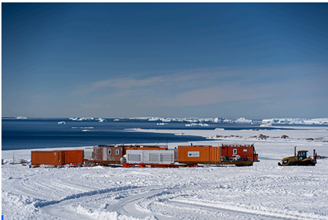
Départ du convoi AWACA de la côte en Terre Adélie. Les traineaux supportant les unités d'observation, l'unité de vie pour le personnel et les réserves de carburant sont attelés aux tracteurs qui les achemineront jusqu'aux différents sites d'observation du projet.