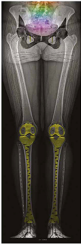
TITRE: L'ET HOMIN FORMAS : 28_21A2A UNIVERSITÉ MONTPELLIER SUR BIASSAC