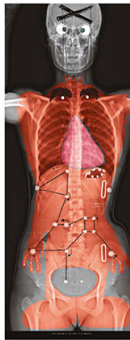
TITRE: PROTECTORAT: CANTON D'UN PAYSAN FORMAS : 28_21A2A UNIVERSITÉ MONTPELLIER SUR BIASSAC

Catalogue d'exposition - Sandrine Estrade-Boulet - Corps rayonnants