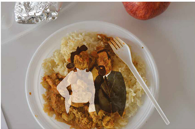
VIMANOVIZ - Pierre et Marie Curie