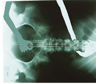
TITRE: PANORAMA DU PARANTHÈRE FORMAS : 28_21A2 UNIVERSITÉ MONTPELLIER SUR BIASSAC