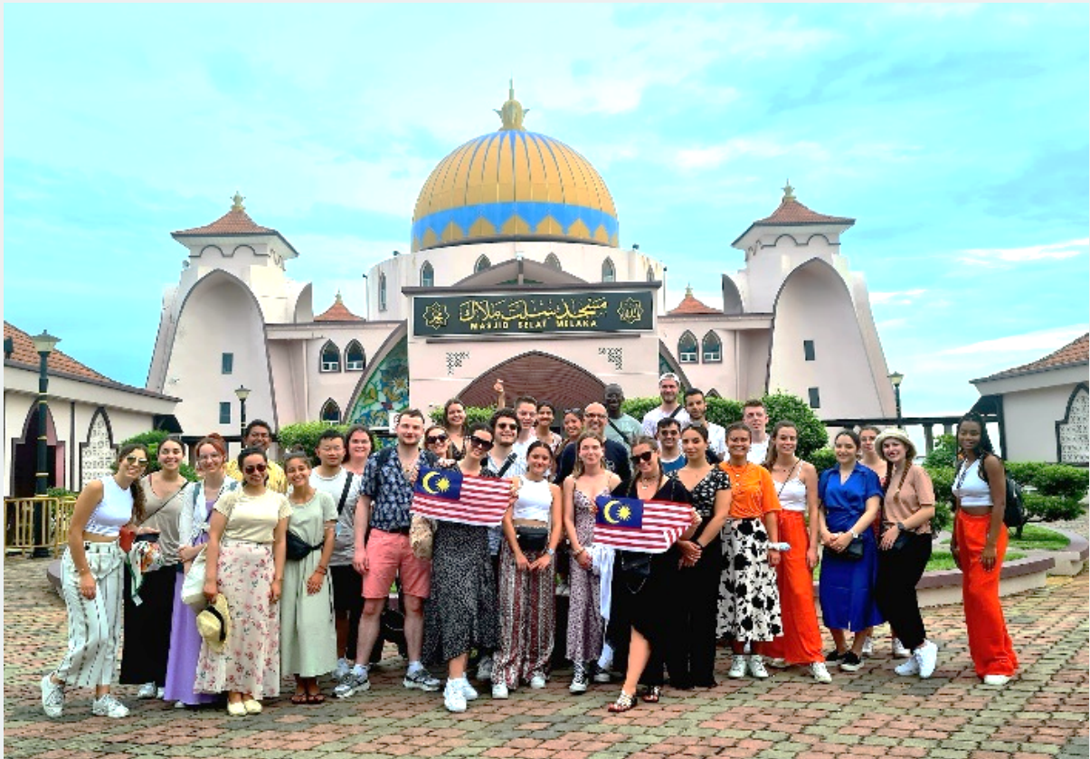
Visite de la ville de Malacca et rencontre avec la communauté Chetti