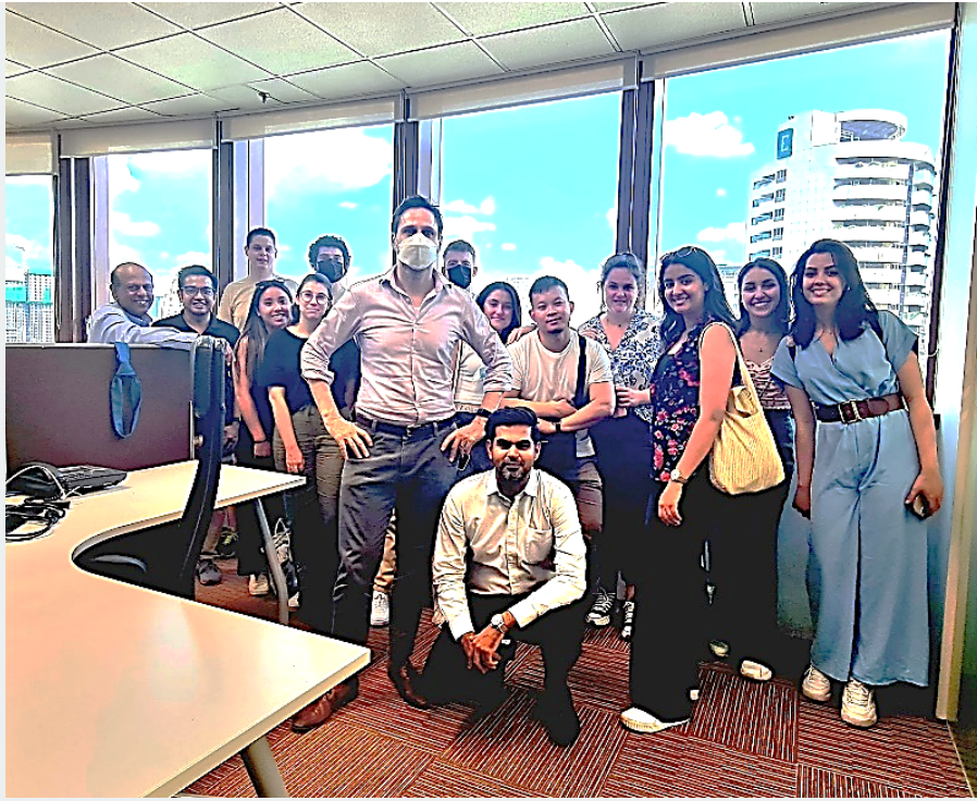
Visite des bureaux de l'AFP de Kuala Lumpur