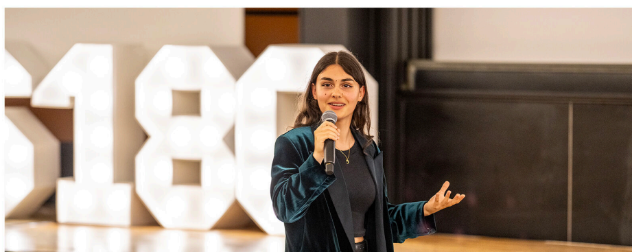
finalistes et les commédiennes