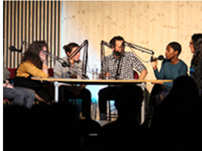
L'Engagement : Valorisation / UE