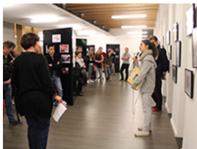
Création et gestion d'une association