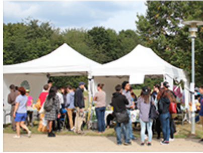
Les associations étudiantes de l'UVSQ