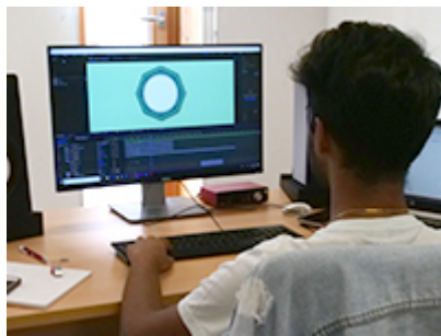
Communiquer à l'UVSQ