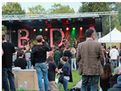
Organiser des événements