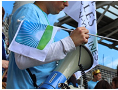
Financer ses projets