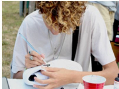
Les actualités des initiatives étudiantes