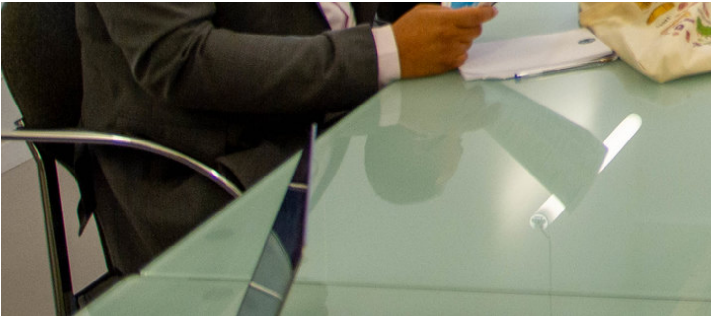
Visite de la Maison de l'Etudiant