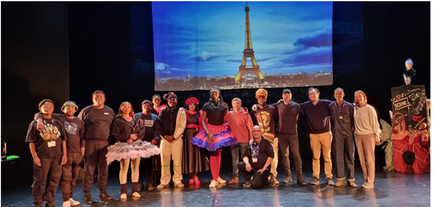
Toute l'équipe regroupant danseurs et concepteurs avant le spectacle Unlimited