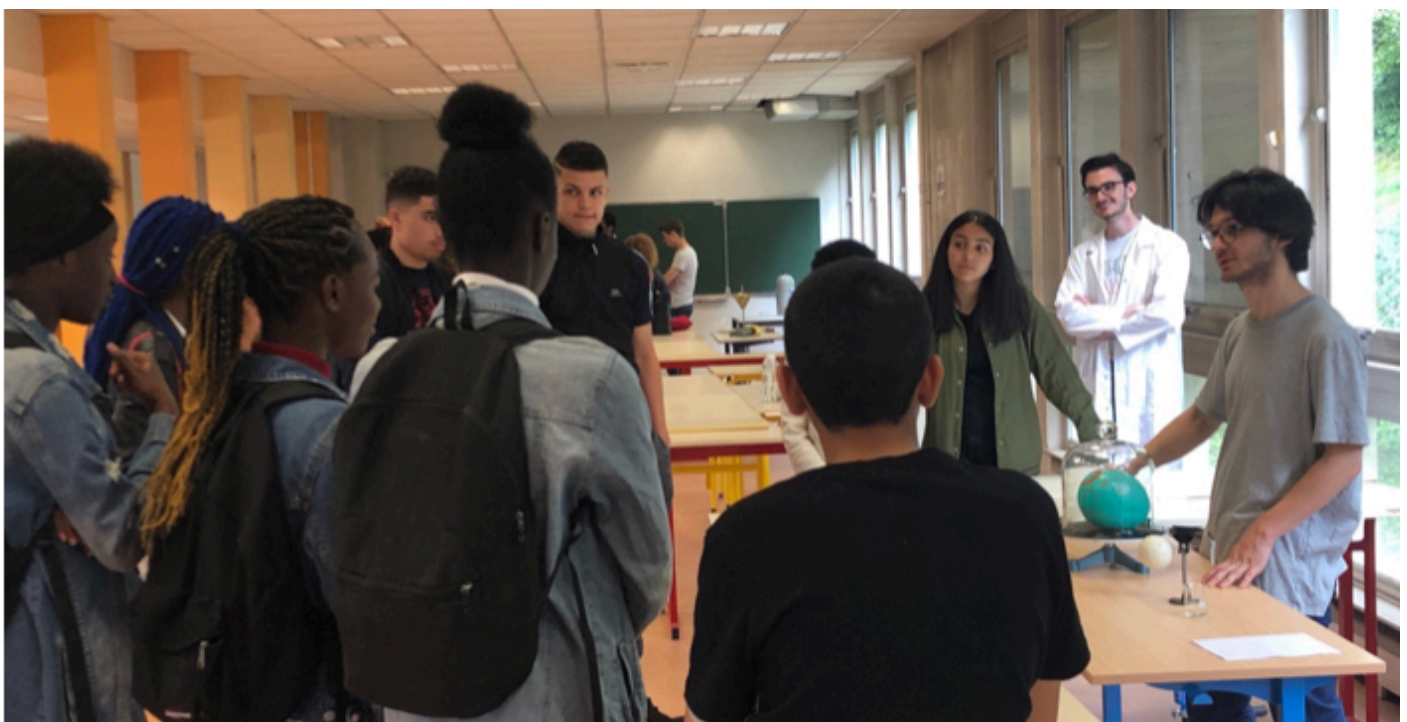
La physique en questions» sur le campus des Sciences de Versailles

L'engagement pour la réussite des études supérieures est une valeur primordiale pour l'université. Depuis 2008, l'UVSQ est partenaire des Cordées de la réussite, un dispositif national qui encourage les élèves issus de réseaux d'éducation prioritaire à poursuivre leurs études jusqu'au baccalauréat et après.